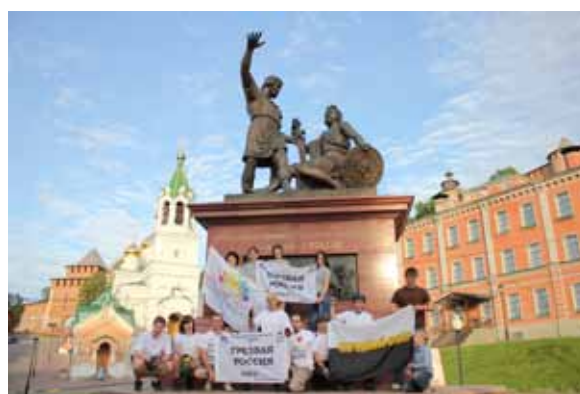
Нижний Новгород - велопробег участников Народного Собора за трезвый образ жизни.

Жители Воронежа уже начинают привыкать к тому, что в центре города активисты Воронежского регионального отделения Движения «Народный Собор» разворачивают