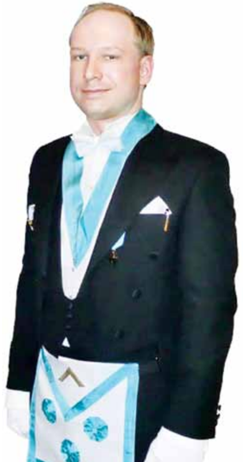
Андерс Брейвик в масонской облачении.

Если мы предполагаем, что Брейвик мог состоять в тайных обществах, из этого следует, что любые его публичные действия имеют оккультный смысл. Как известно, в оккультной среде нередки акты жертвоприношения для получения поддержки со сто-