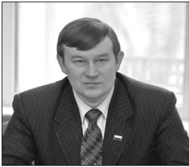
Уважаемые делегаты и гости конференции!

В своем выступлении я постараюсь дать краткую оценку деятельности "Народного Собора" за последнее время и обозначить возможные пути его дальнейшего развития.